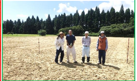
7/22(土) 電柵設置の様子