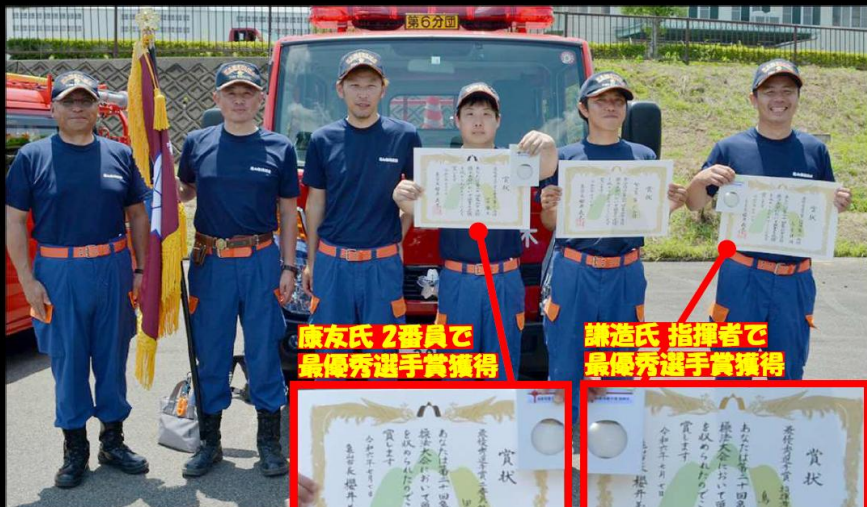
康友氏 2番員で 最優秀選手賞獲得