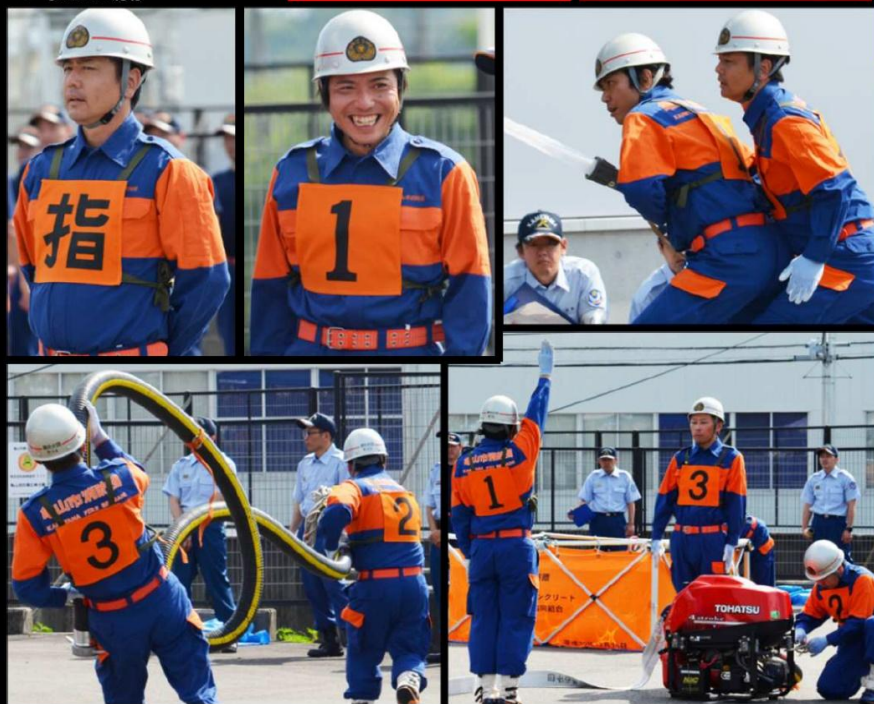
第20回亀山市消防操法大会 タイム結果表