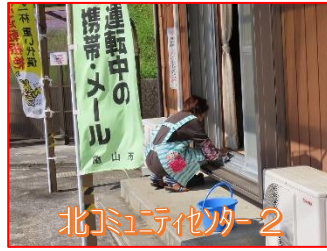
北コミュニティセンター 2