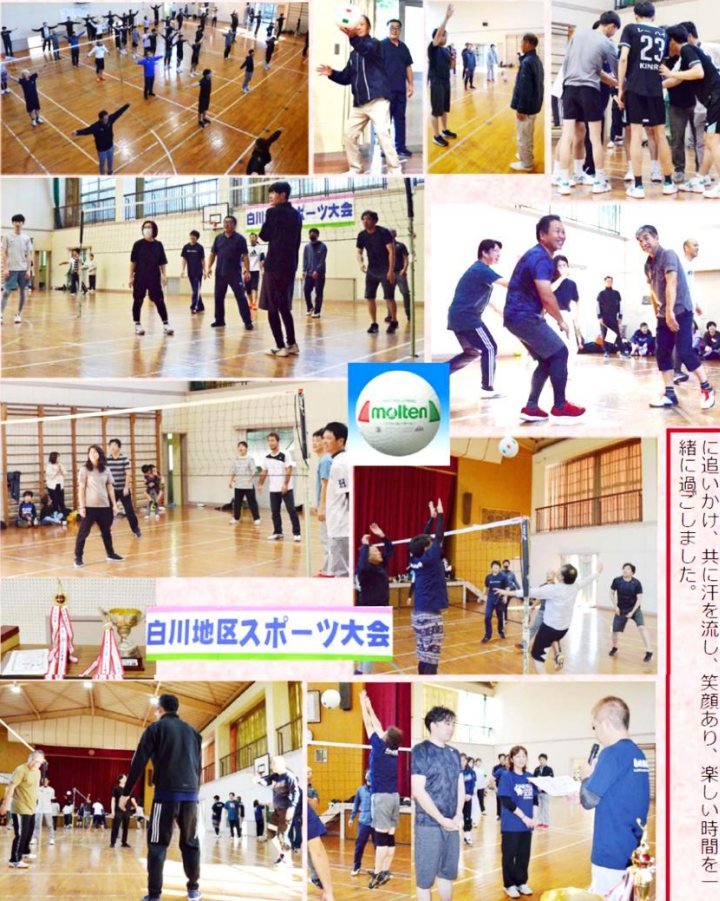
白川地区スポーツ大会

今年には新チーム参入 その実力は如何に? この大会も第9回目を迎える年々参加人数の減少化が進んでおりましたが、今年から新チーム(併せ単レィン)さんへ参入して頂きました。 技能実習生の皆さんに参加して頂き、地区大会から一気に国際大会となりました。国籍が異なっても白球を真剣に追いかけ、共に汗を流し、笑顔あり、楽しい時間を一緒に過ごしました。