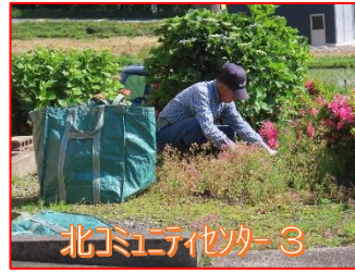
北コミュニティセンター 3