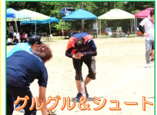
グルグル&シュート