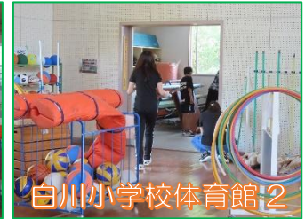
白川小学校体育館 2