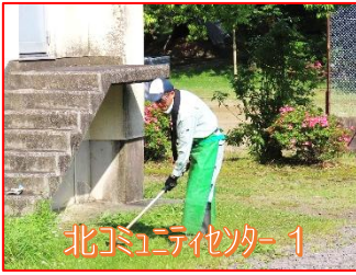
北コミュニティセンター 1