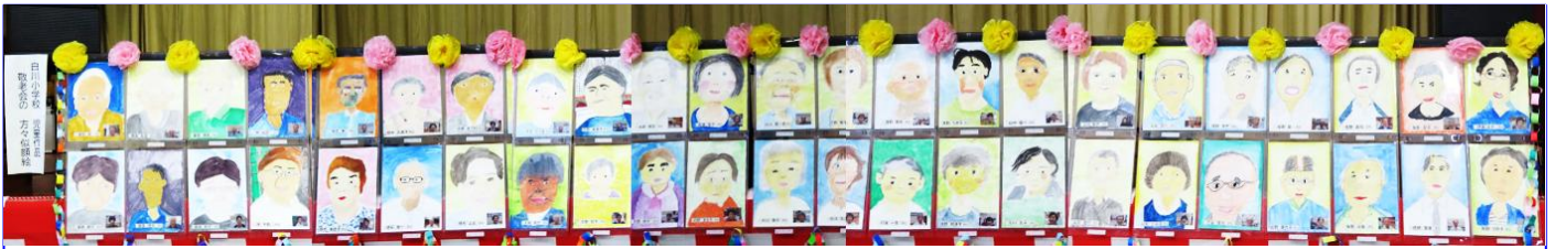
敬老会招待者46名の似顔絵を白川小児童全員が描きました。出来栄に皆さんびっくり!