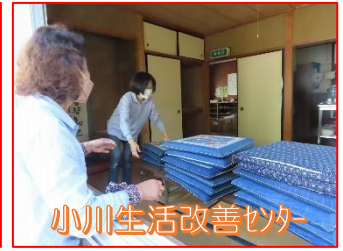
小川生活改善センター