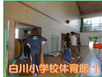
白川小学校体育館 1