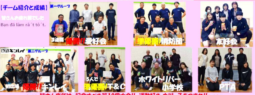
[チーム紹介と成績] 皆さんの盛りだくさん Ban dā lām rā 'tō 't.