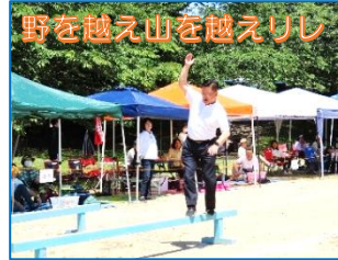
野を越え山を越えリレ