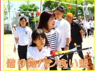
借り物パン食い競