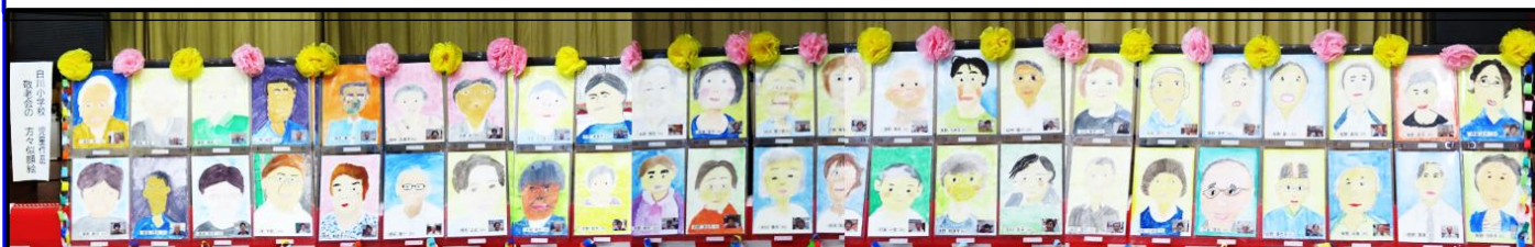
敬老会招待者46名の似顔絵を白川小児童全員が描きました。出来栄えに皆さんびっくり！