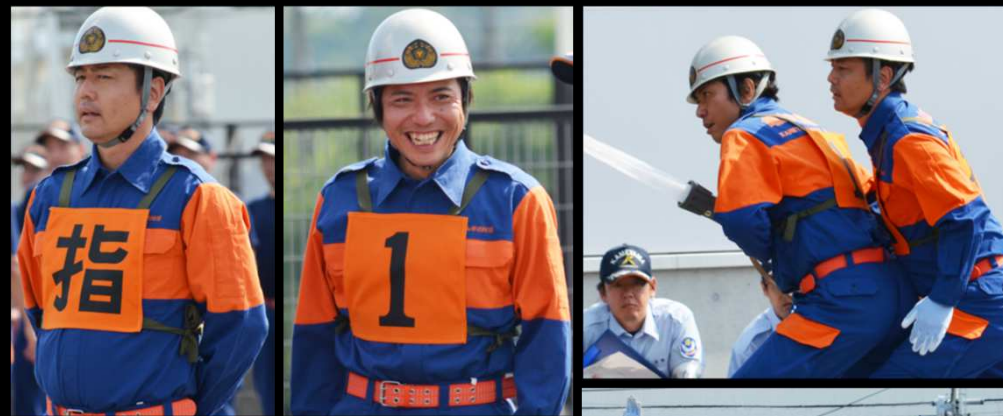
第20回亀山市消防操法大会 タイム結果表