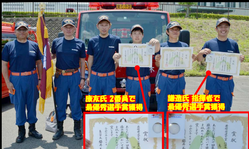
康友氏 2番員で 最優秀選手賞獲得