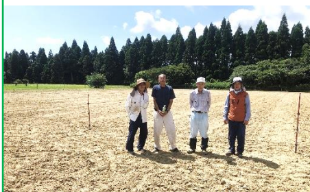
7/22(土) 電柵設置の様子