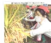
2022.9.13(日) 中日新聞 松山版