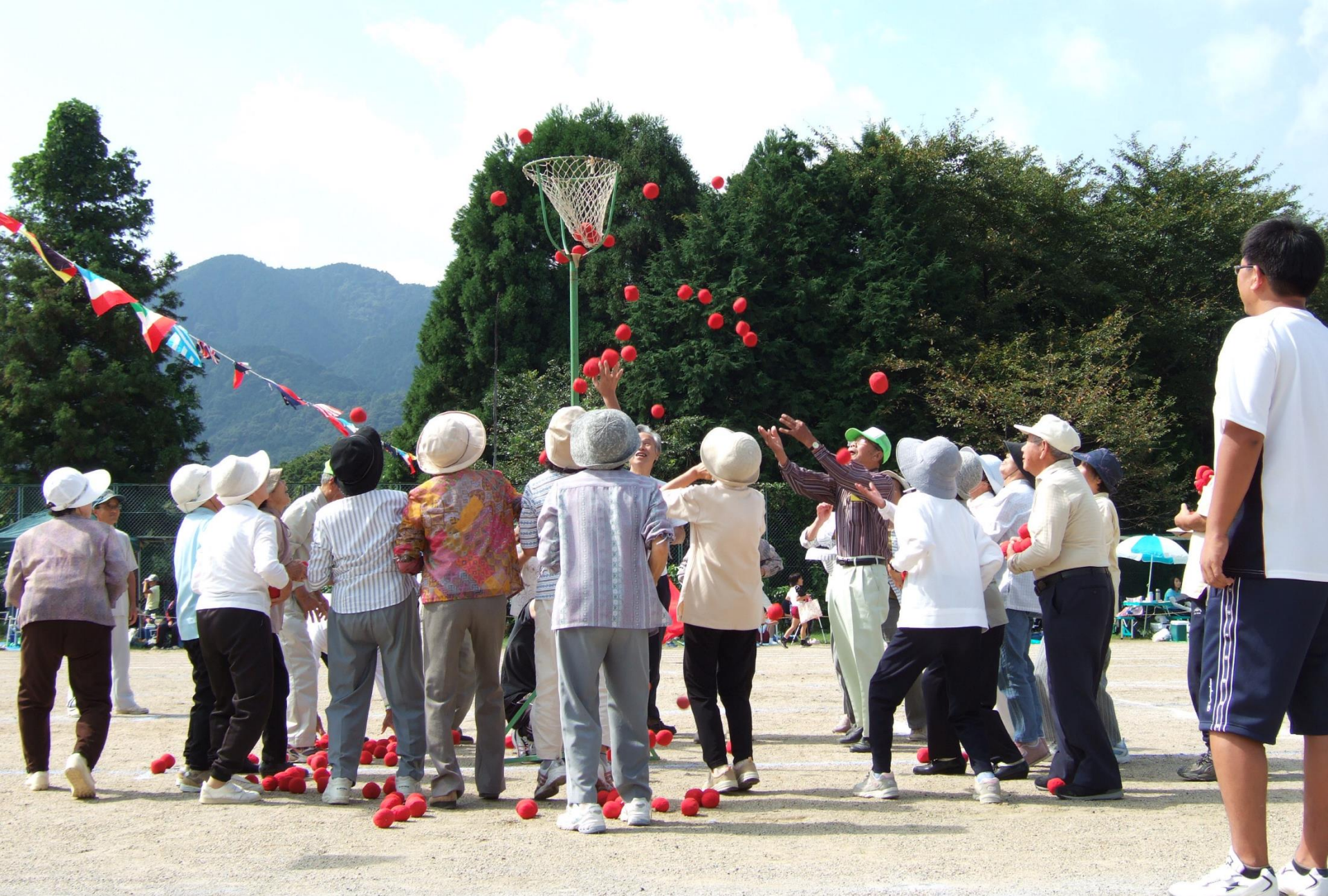
平成20年 運動会 老人クラブも大忙し。