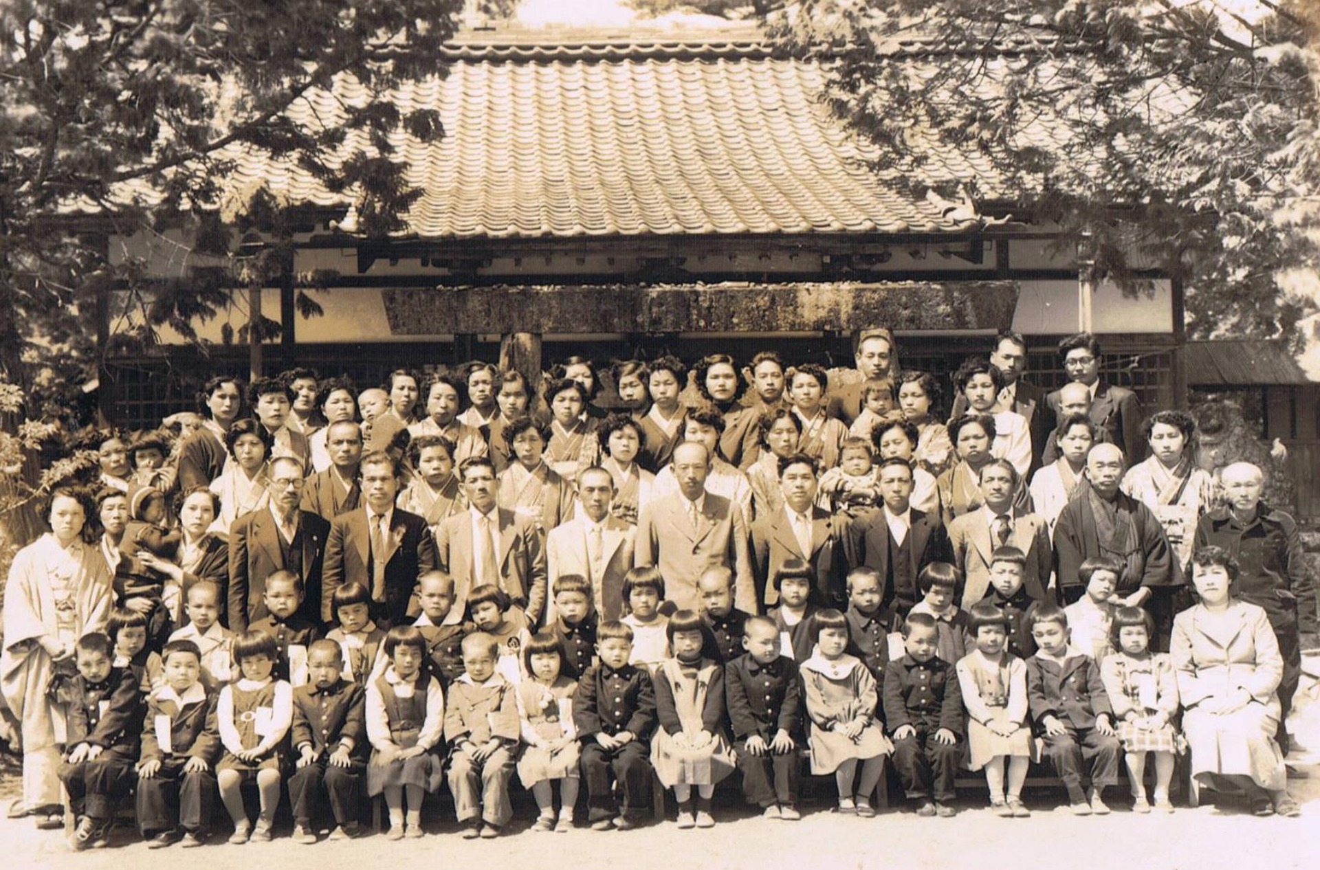
昭和28年白川神社での入学式。授業もここで受けた。