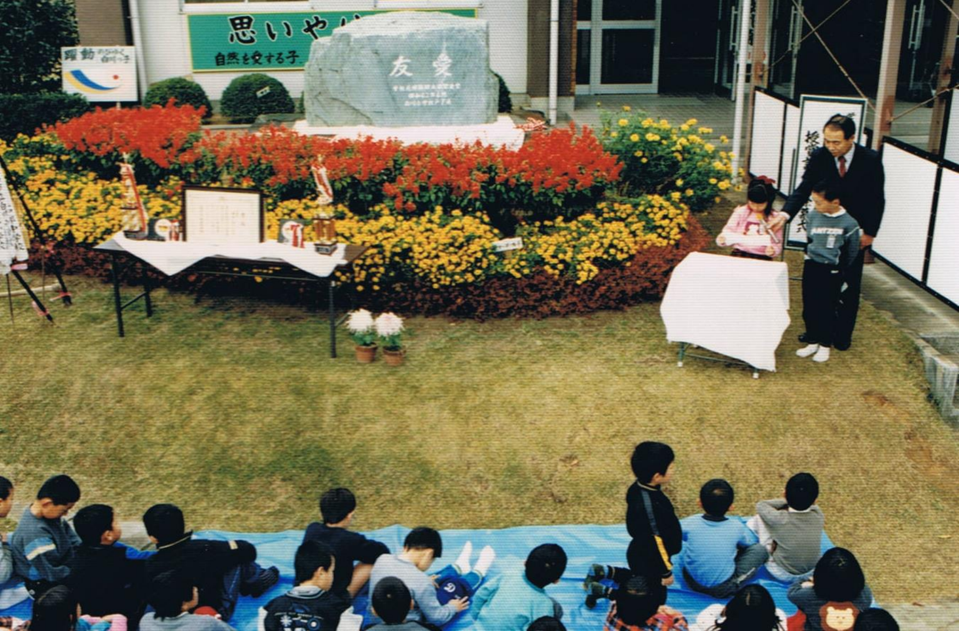
昭和62年友愛の稗除幕