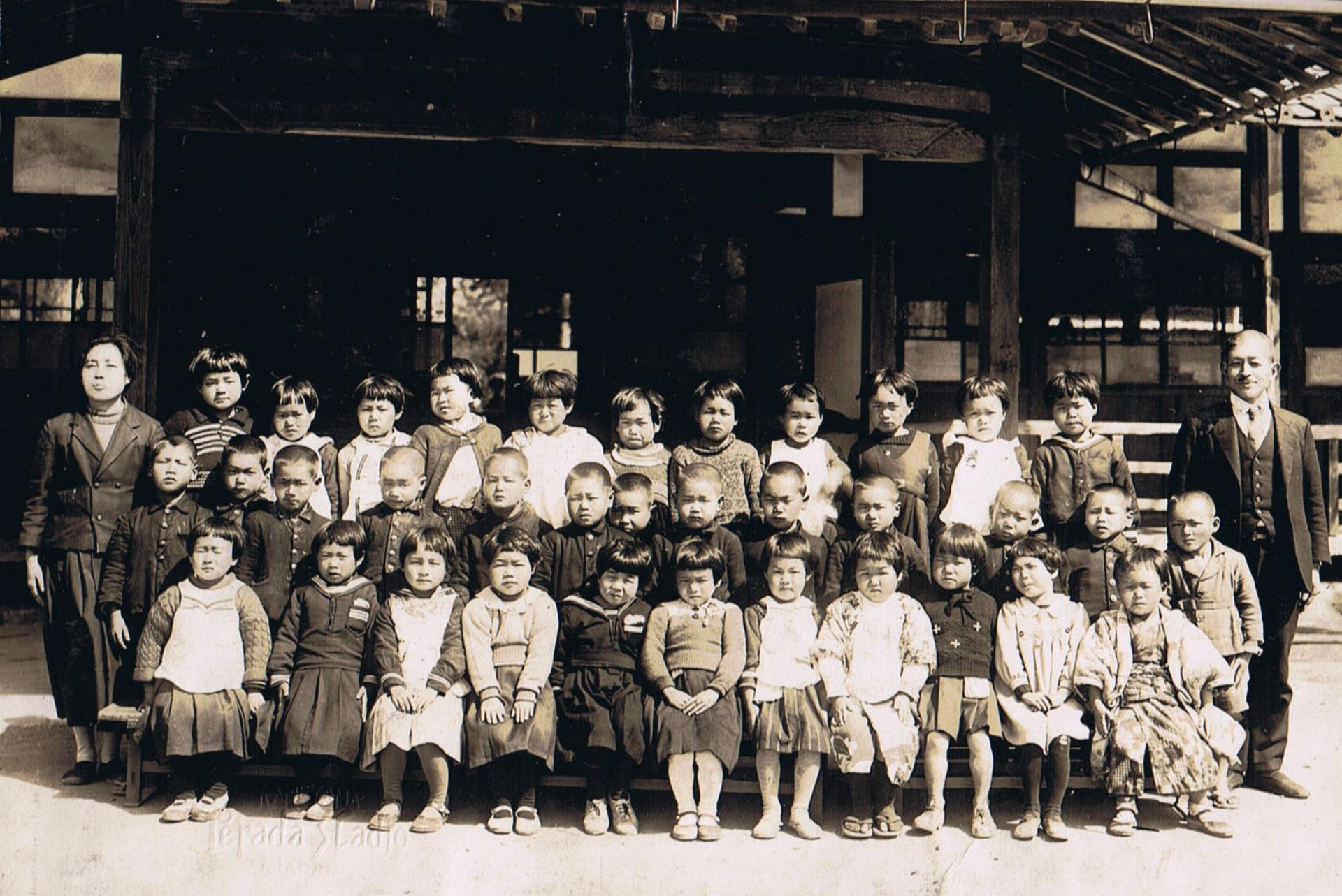
昭和16年入学式（小学校提供）