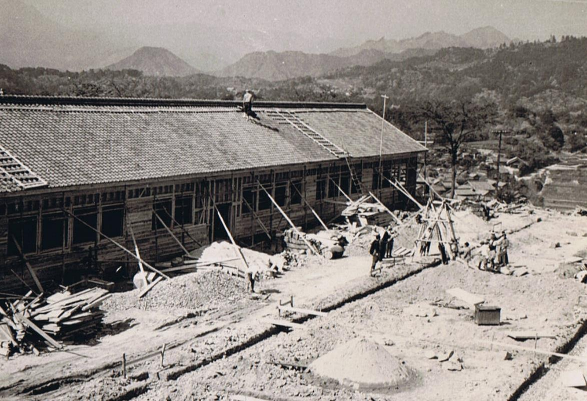
昭和28年 小学校屋根工事。