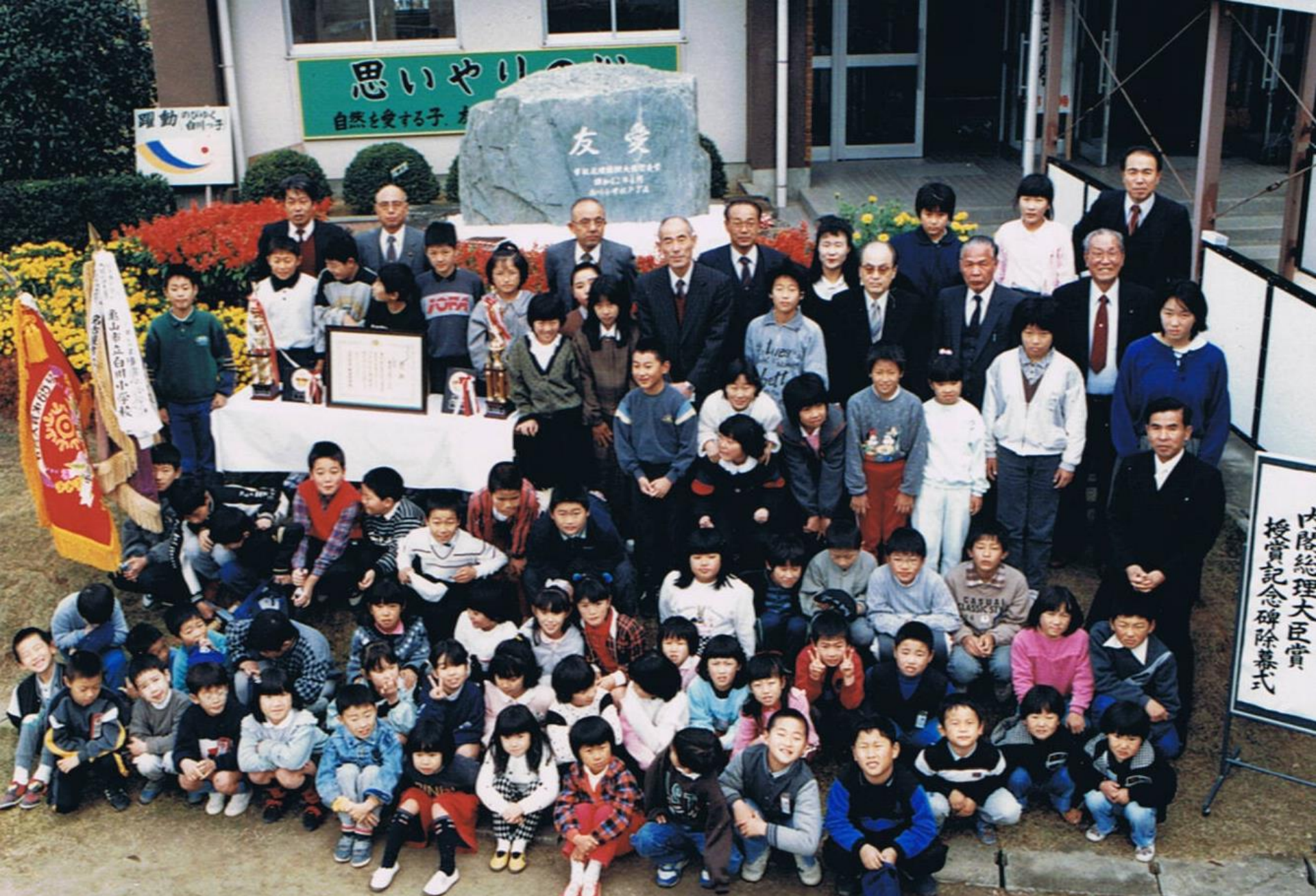
昭和62年友愛の碑 除幕記念撮影