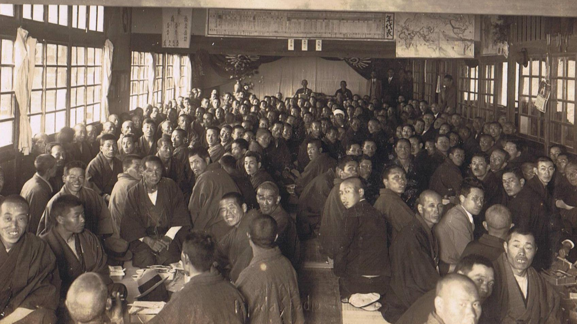
昭和10年何の催しか？ 北校舎講堂、東より西の来賓席を撮影。