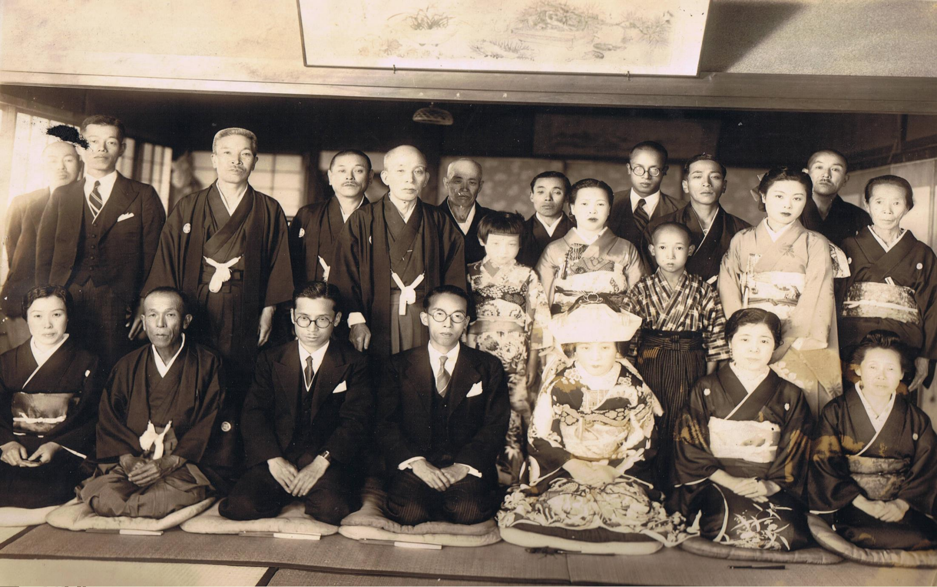
昭和初期の結婚式