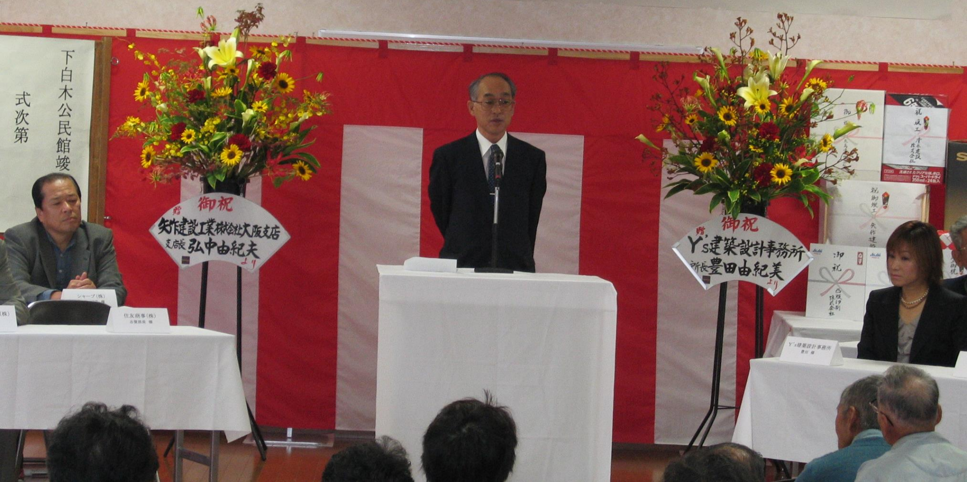
平成17年 下白木公民館竣工式