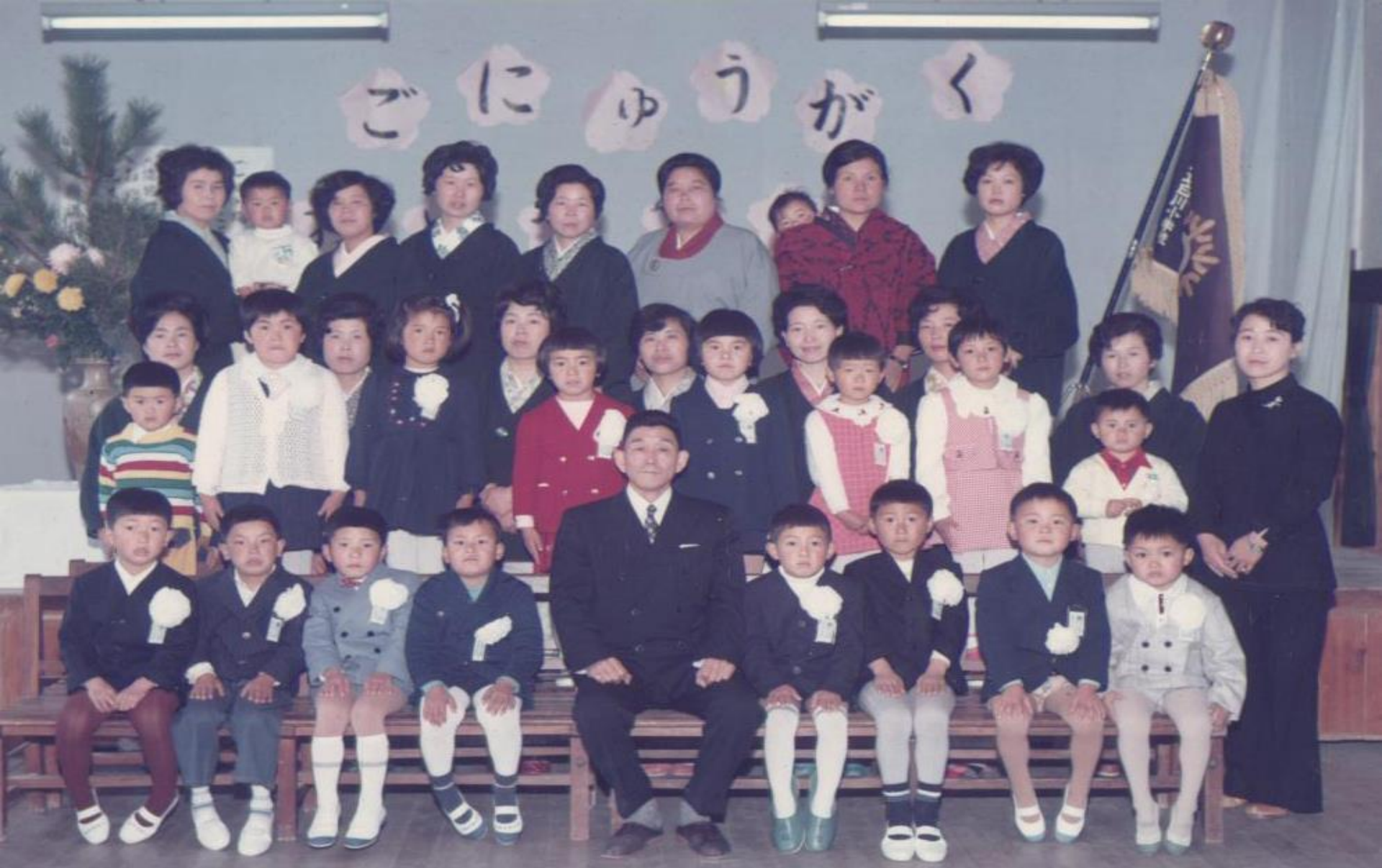
昭和49年 入学式