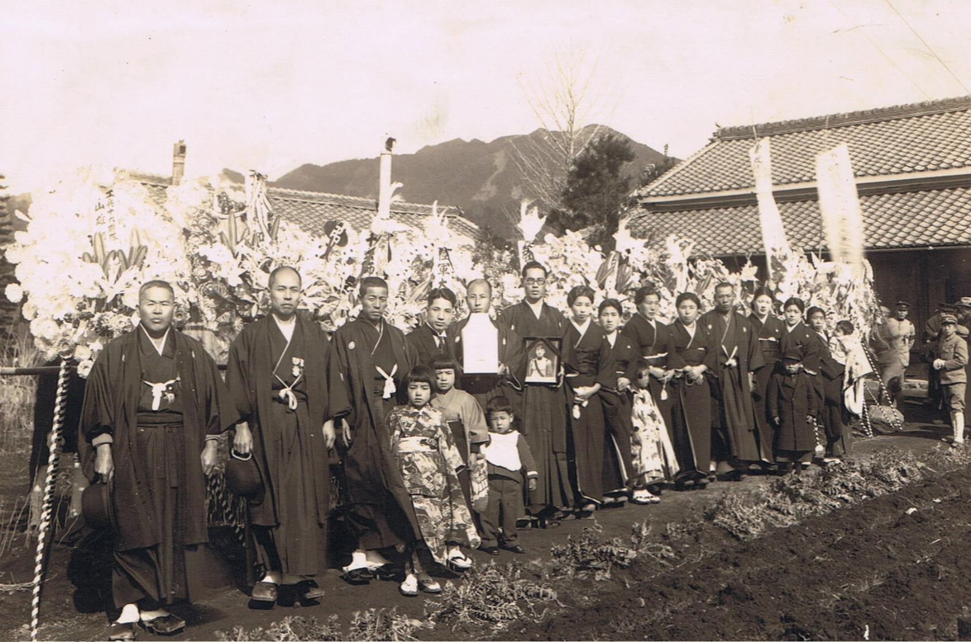
昭和初期村葬