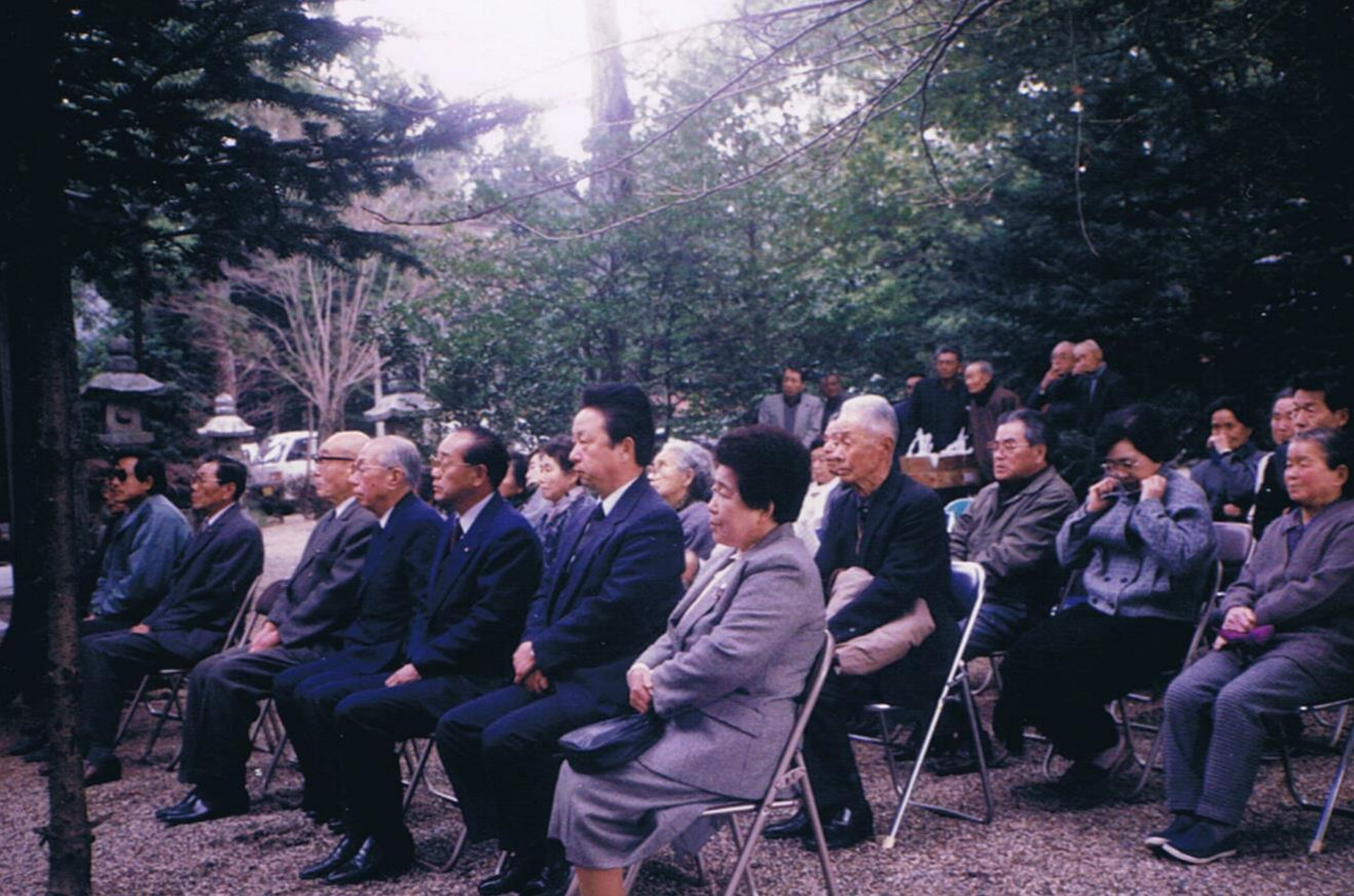
平成3年慰霊祭（白川神社）