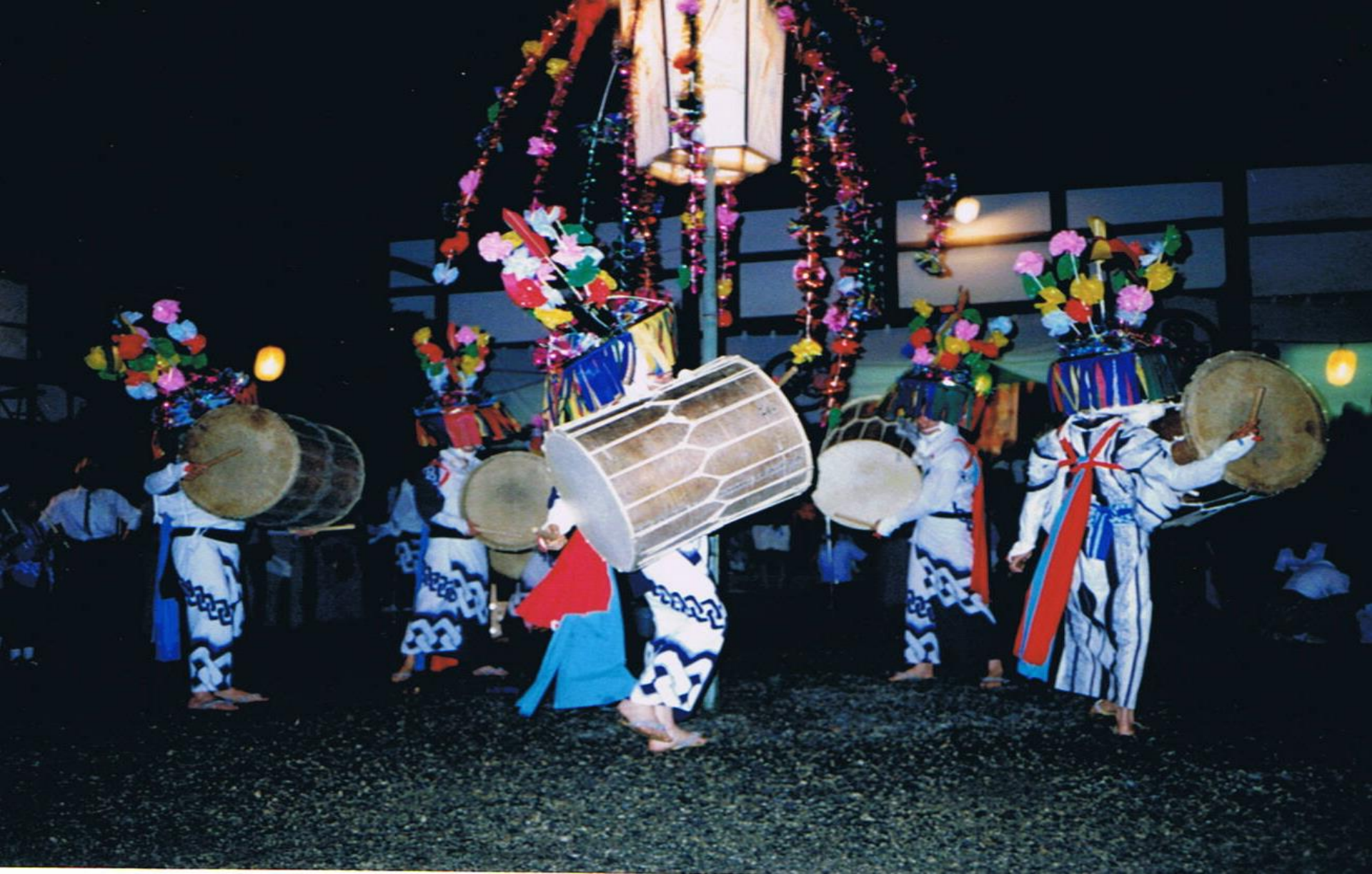
平成2年頃か かんこ踊り (万寿寺)