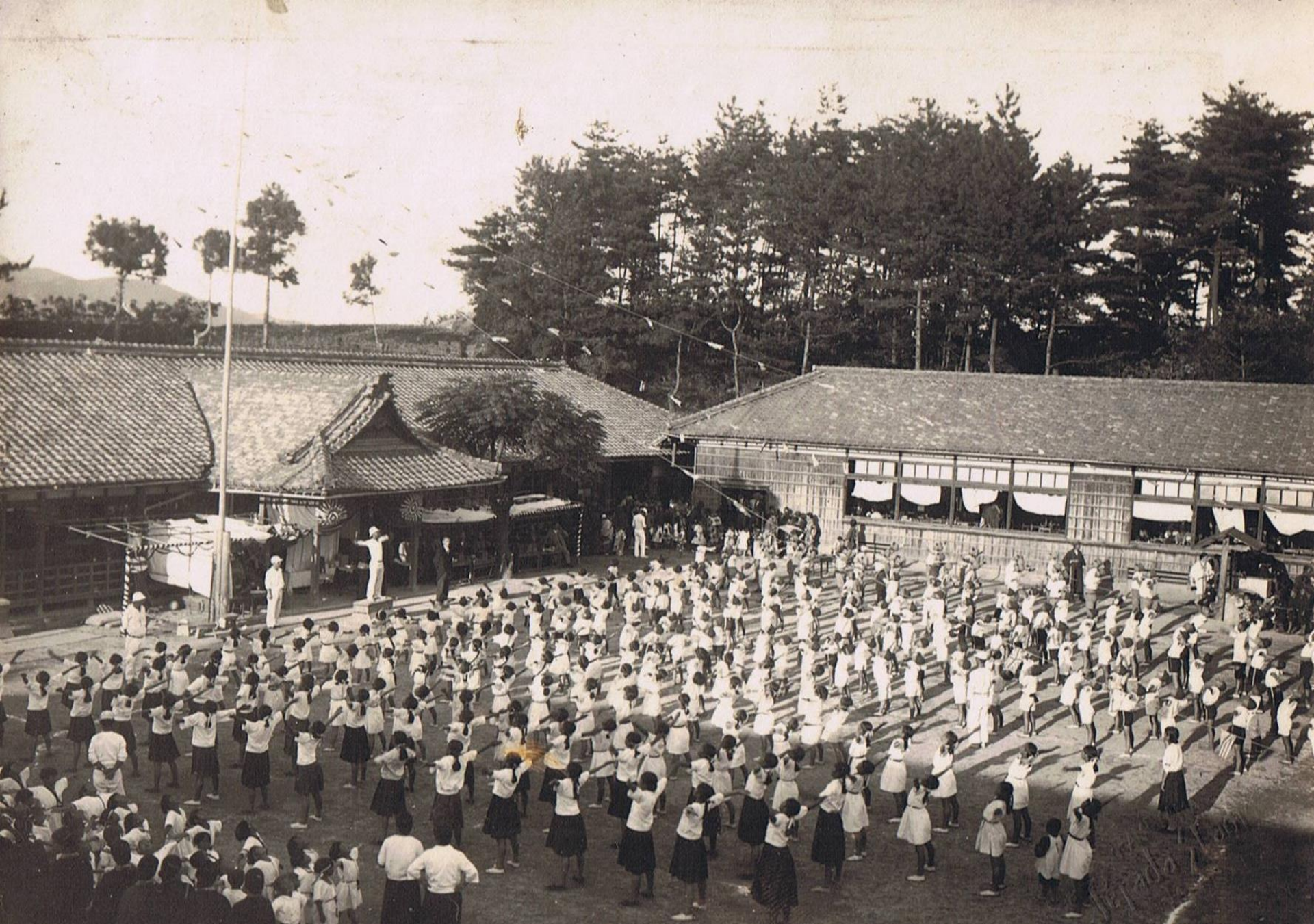
昭和16年運動会（小学校提供）