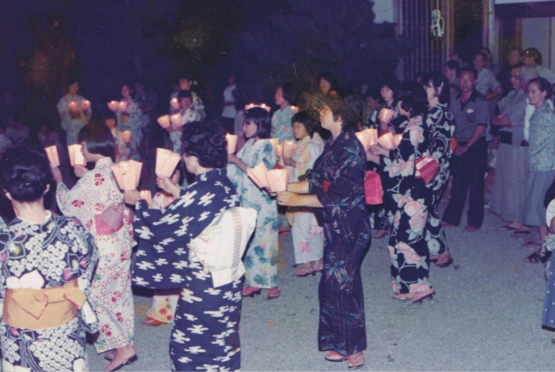
昭和50年頃（万寿寺）（平川貞光氏提供）