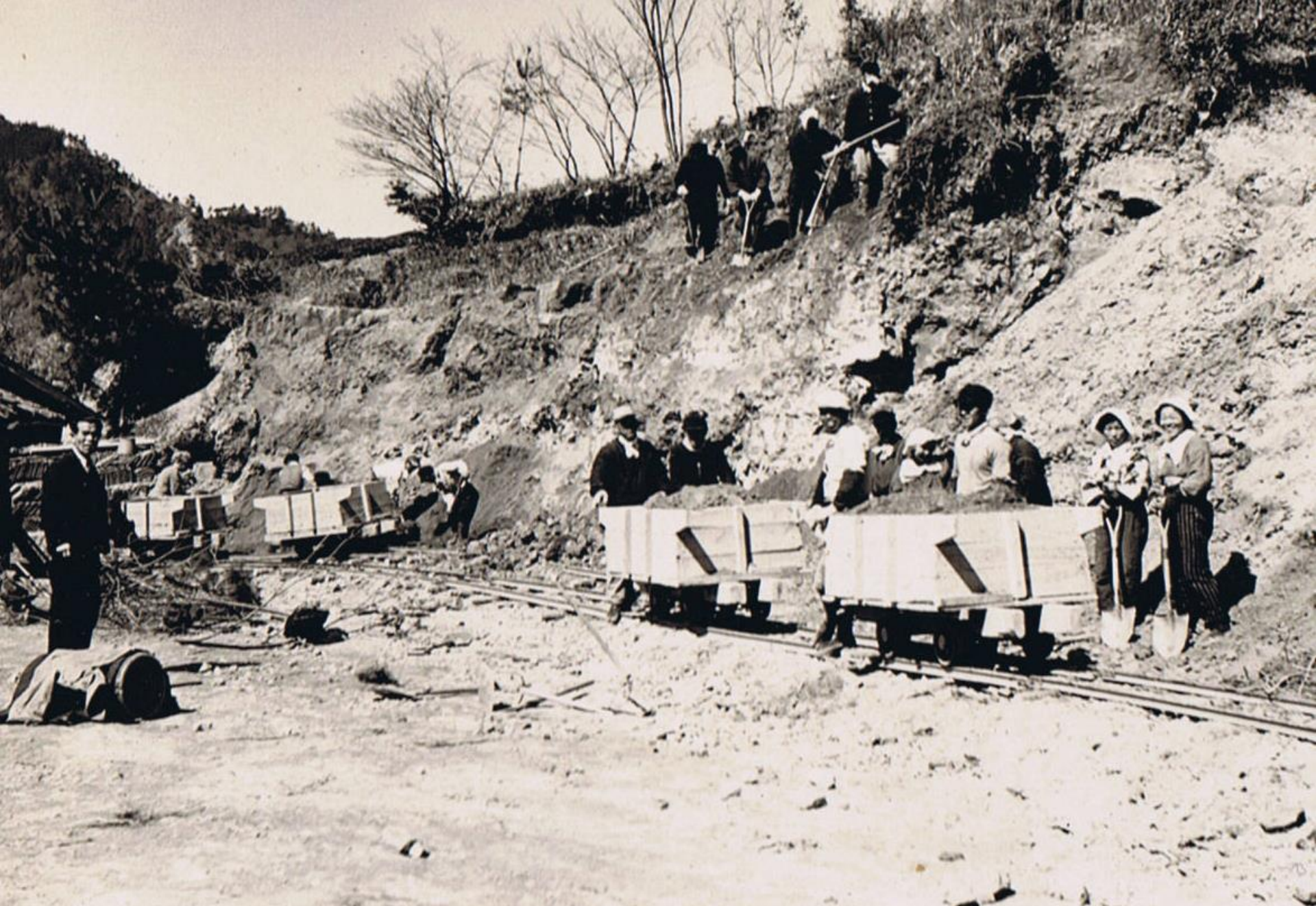
昭和28年頃校舎北側を奉仕作業で土をトロッコで運搬。 この時事故で負傷者が出る。