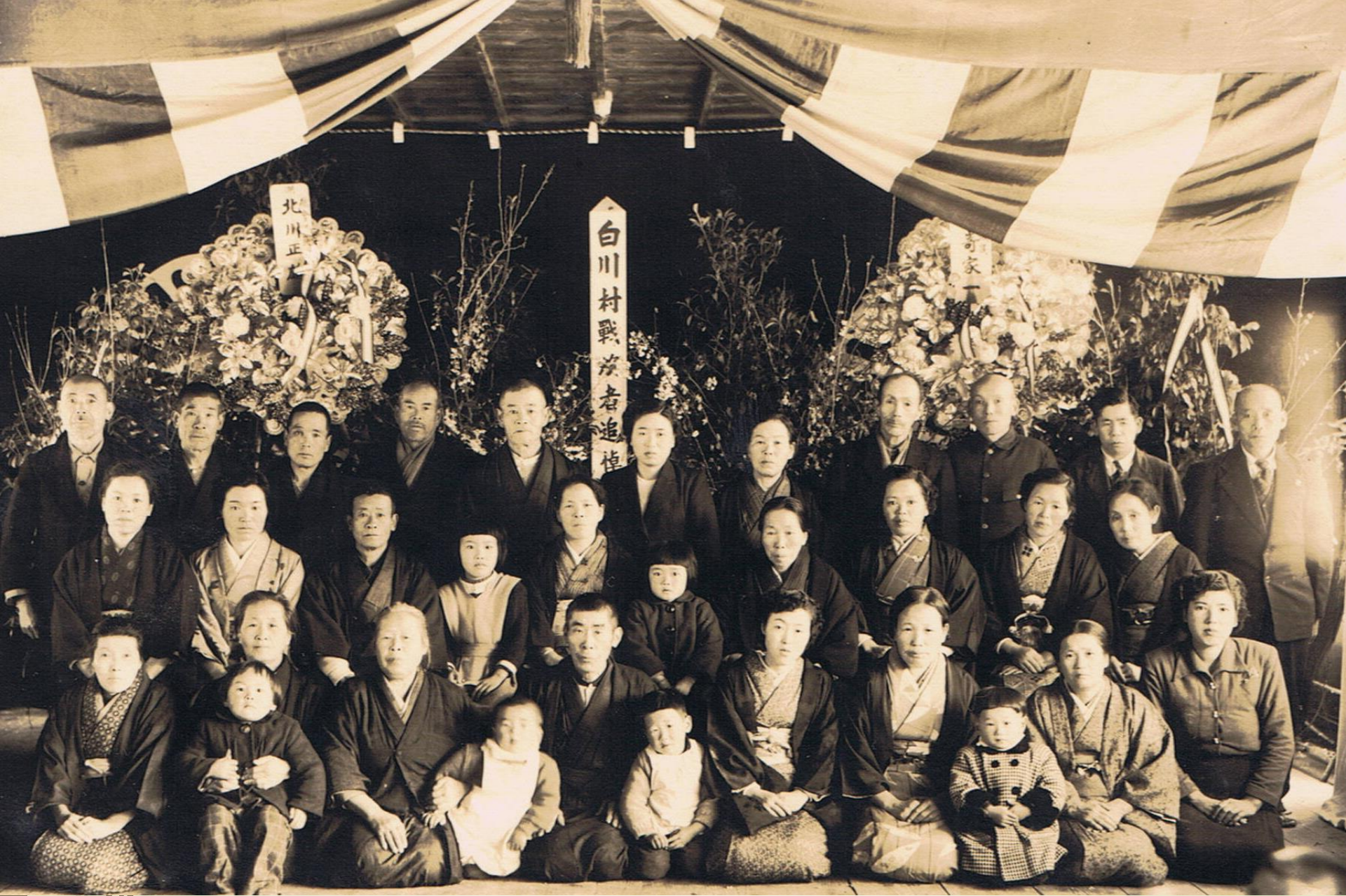
昭和28年戦没者追悼式。