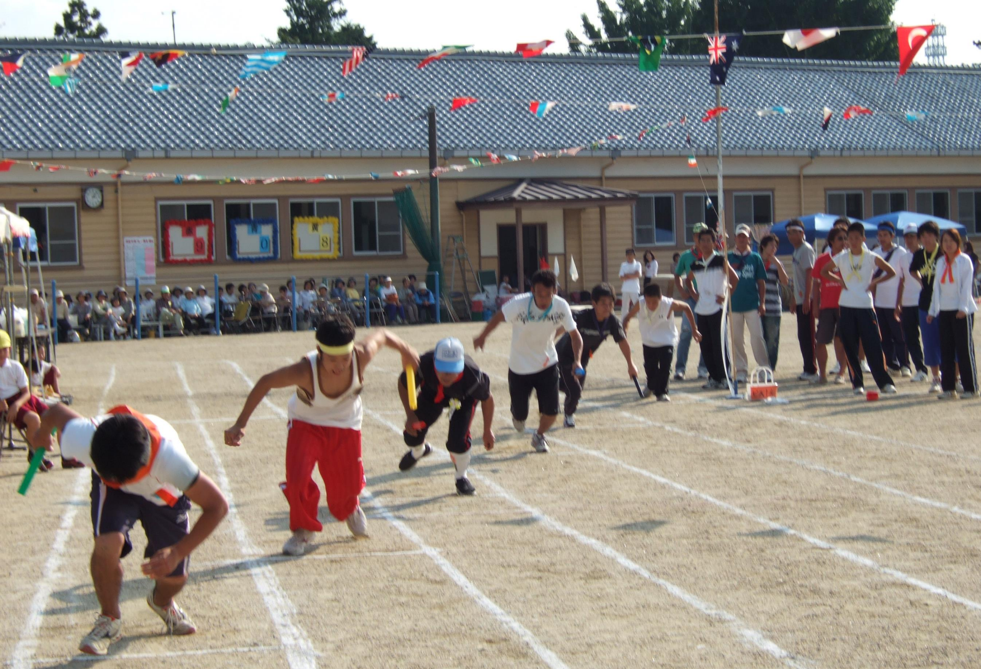
平成20年 運動会地区別対抗リレー