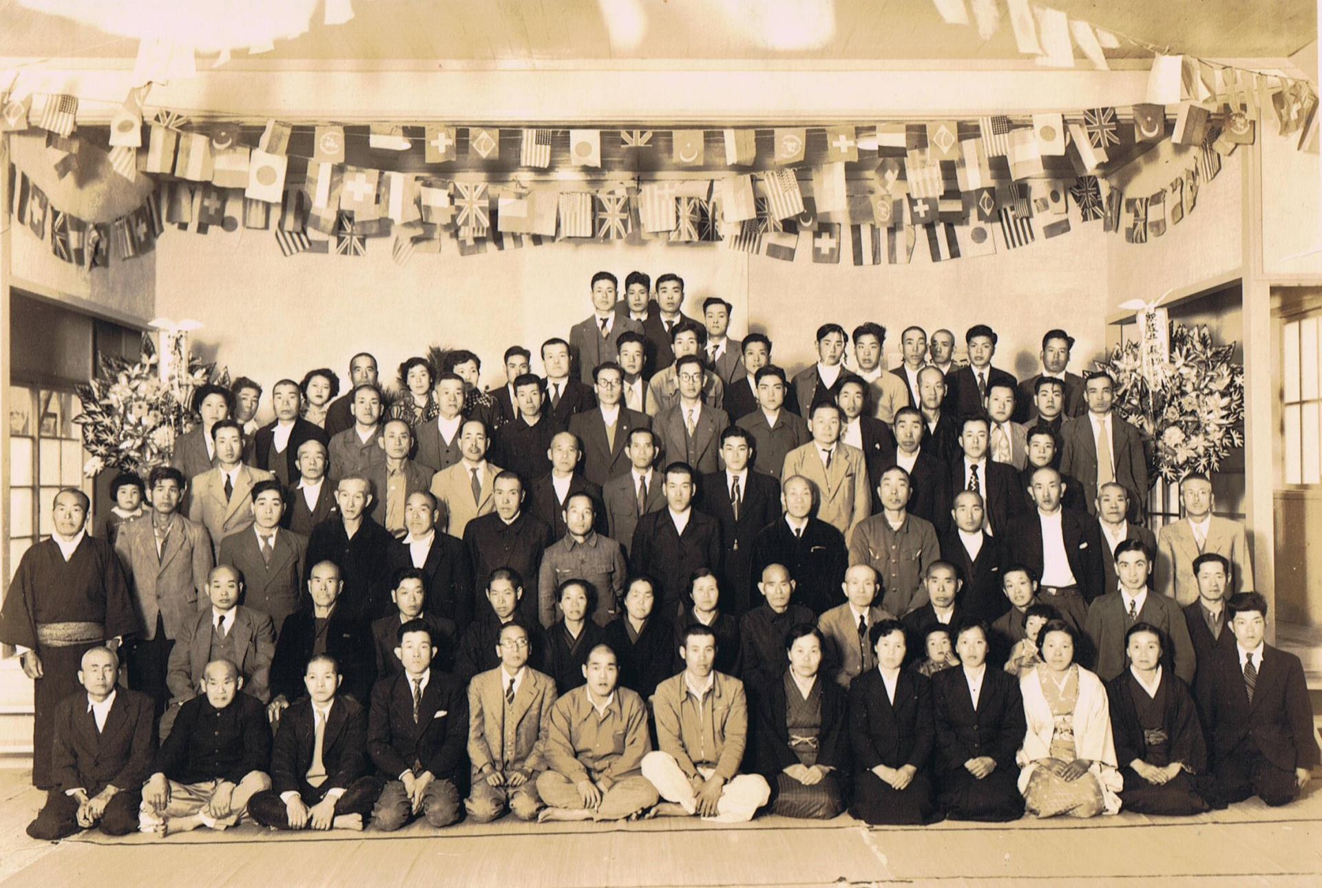
昭和30年 下白木公民館竣工式