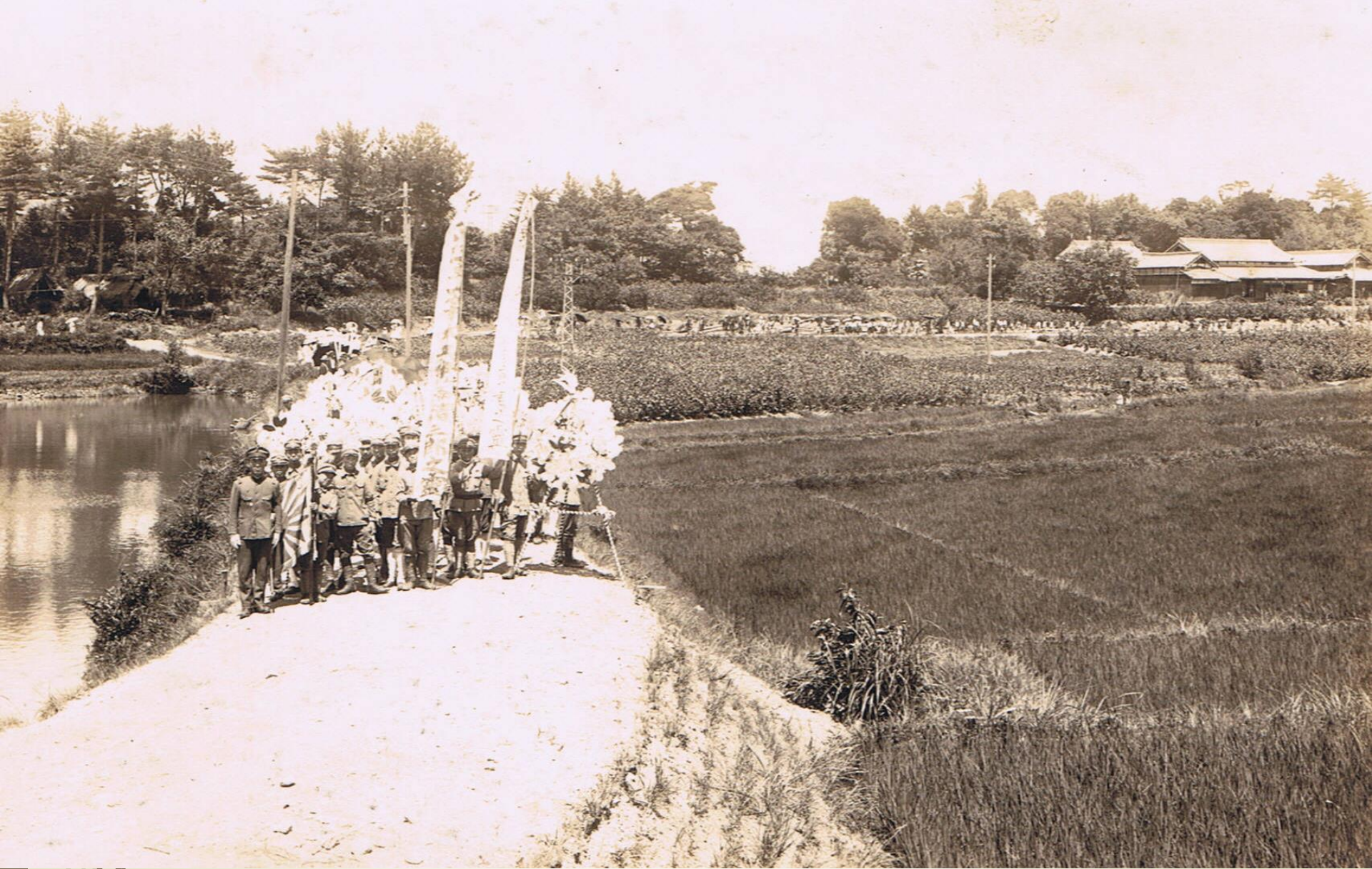
昭和初期村葬