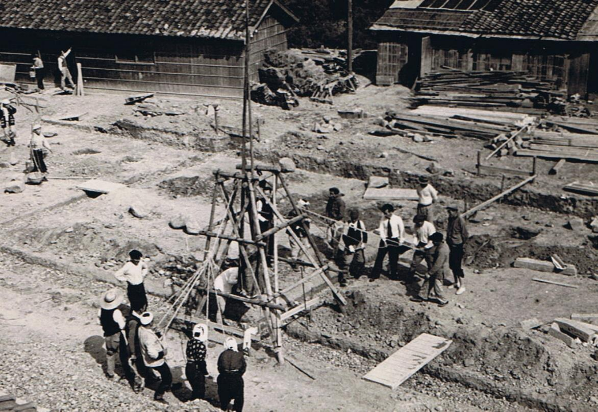
昭和28年小学校基礎工事。人力で基礎石を固める、珍しい工法。