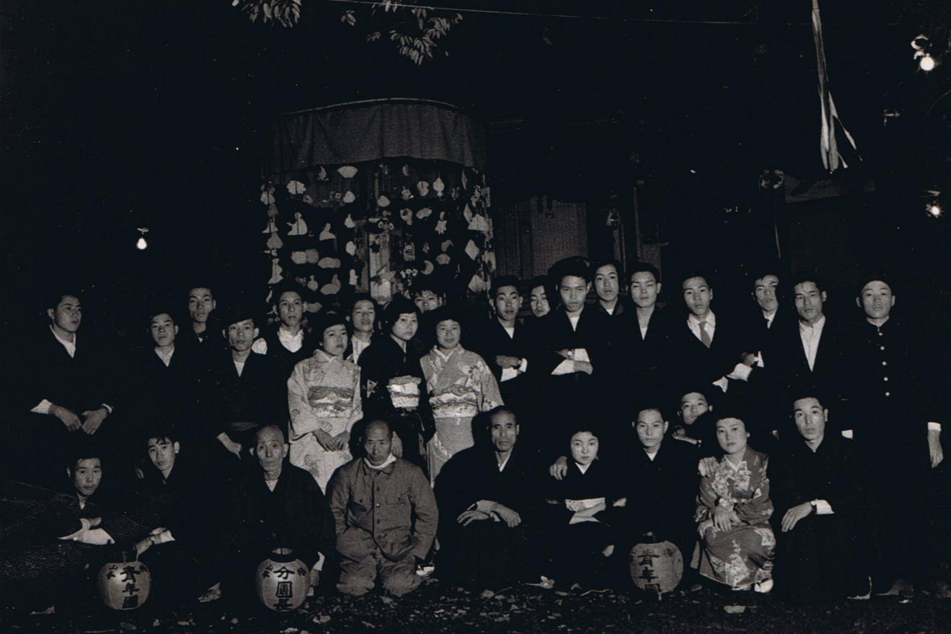
昭和43年頃かんこ踊りの、青年団記念撮影。万寿寺にて