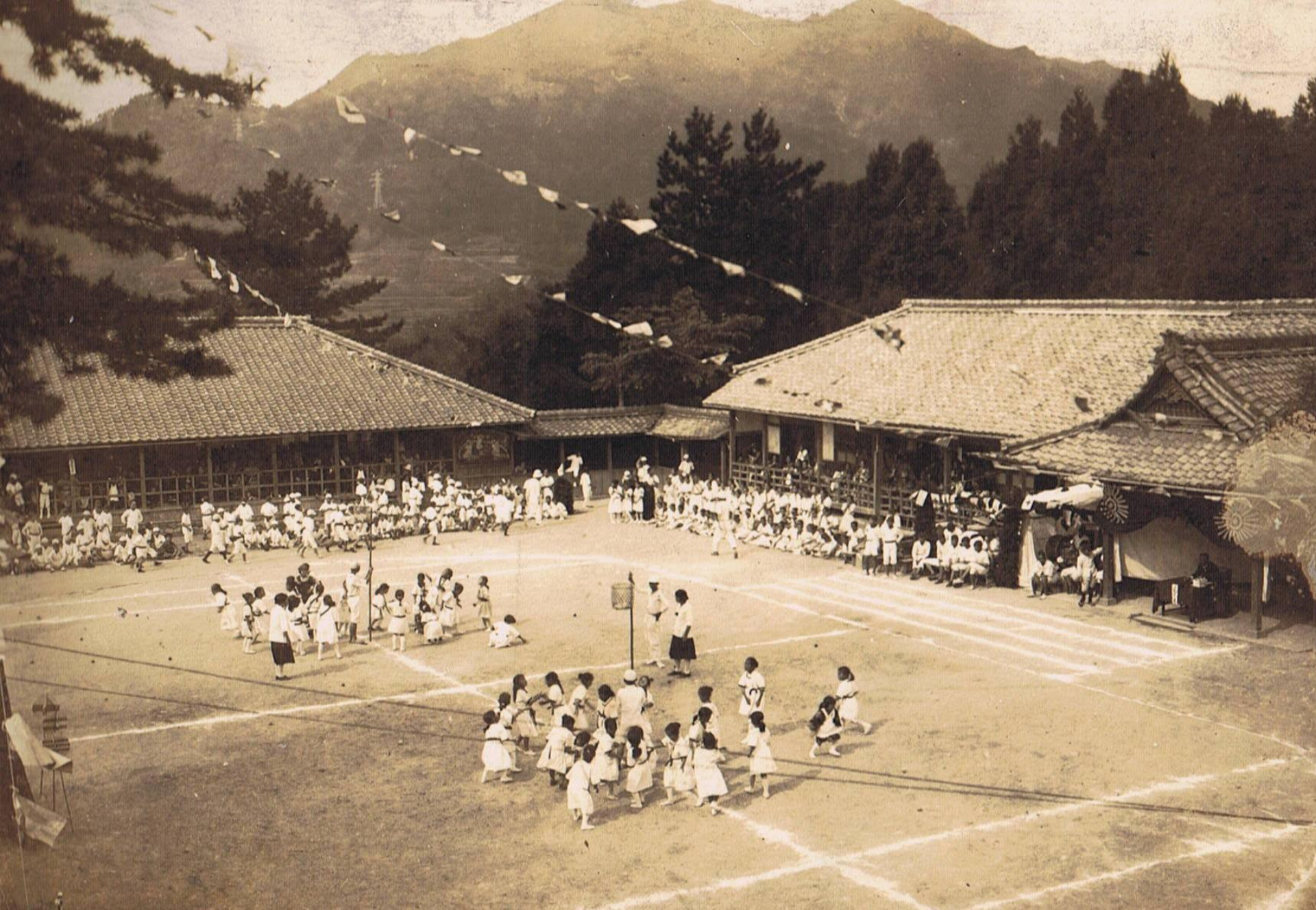
昭和2年運動会 校門より明星ガ岳を望む。