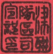
昭和初期召集令狀