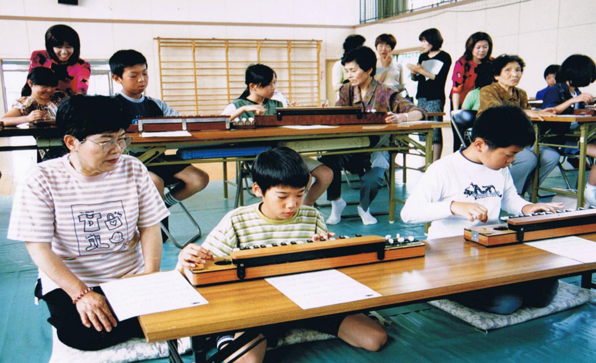
平成13年 和楽器にに触れ合う会を開催し、お琴を教えてもらいました。