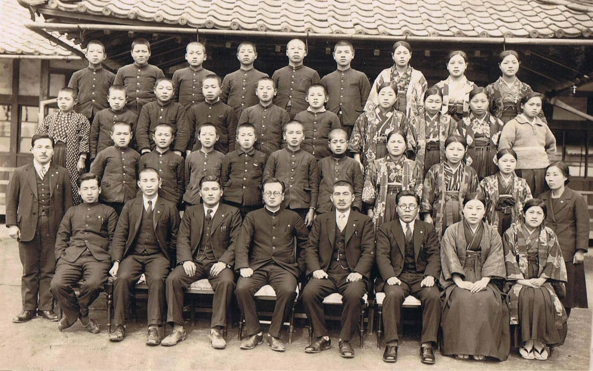
昭和9年高等科卒業式（小学校提供）