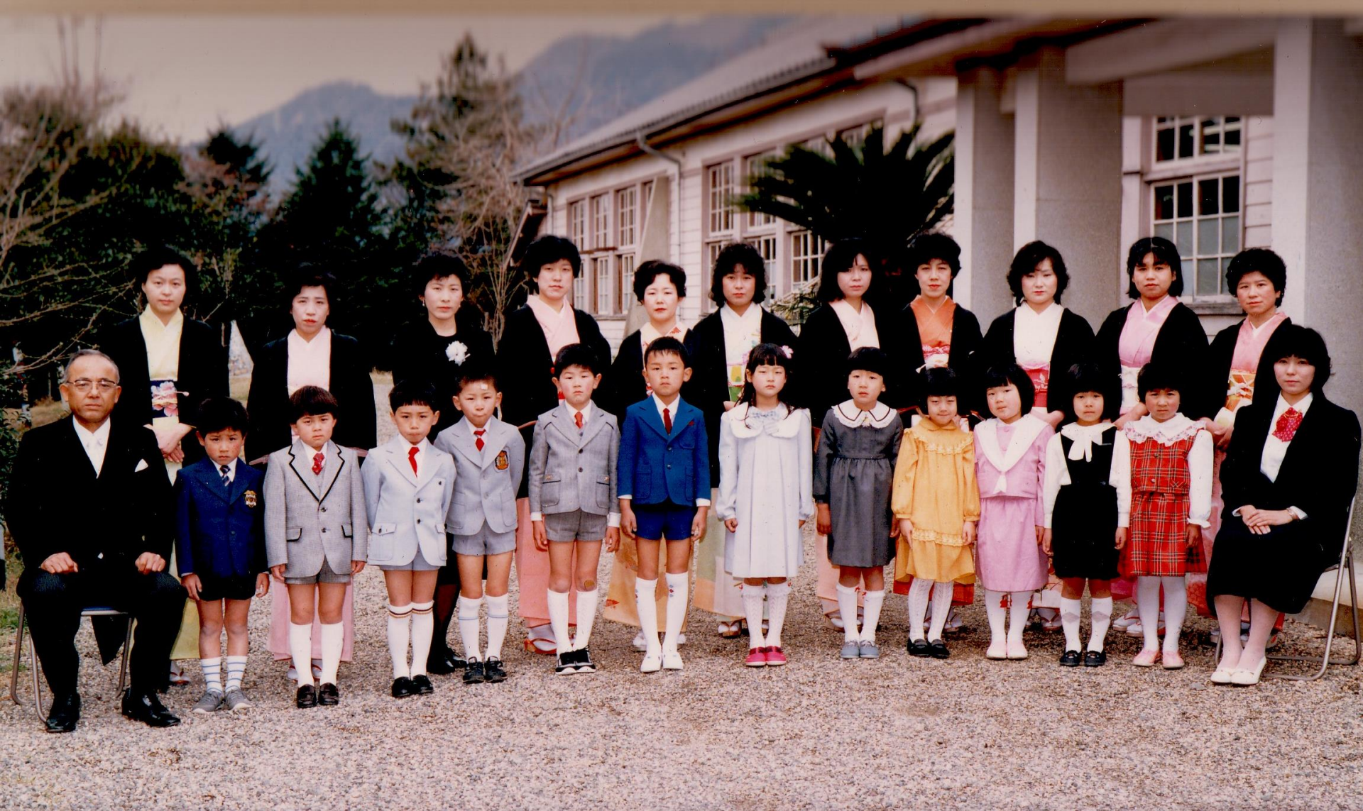
昭和60年 小学校入学式