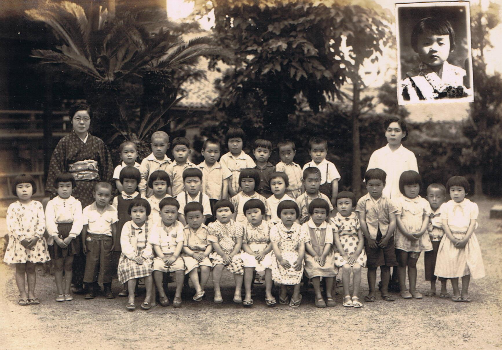
昭和25年頃の誓信寺託児所