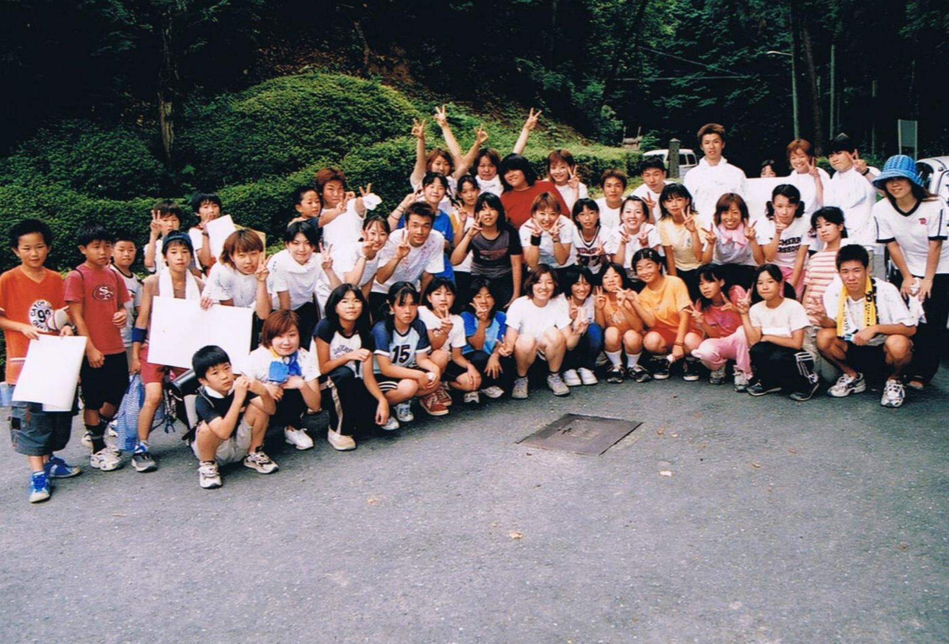
平成14年 神辺小 白川小 三重大学3校合同キャンプ。