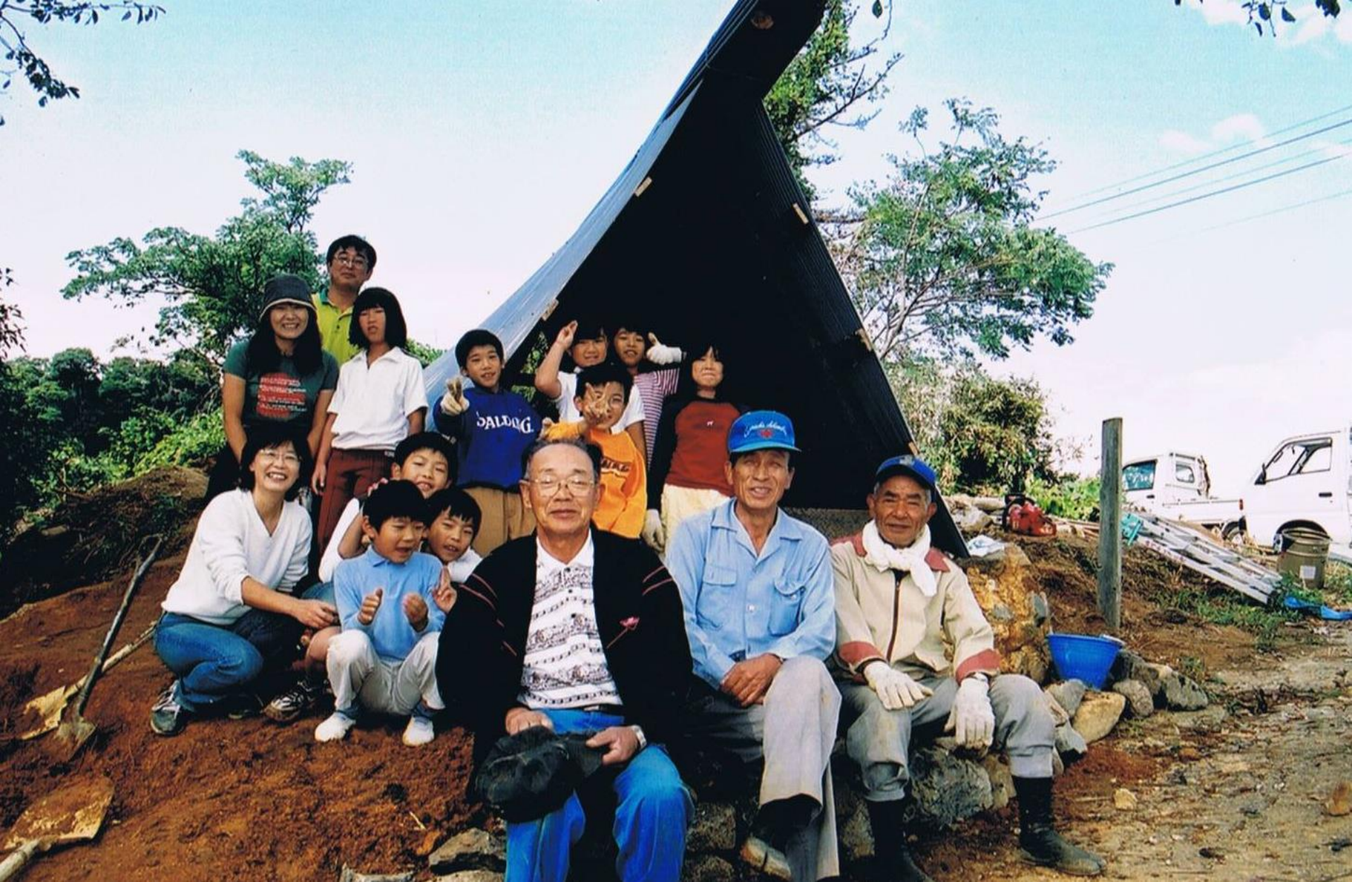
平成14年 小川炭グループのおじさんと、 炭焼き窯を作りました。