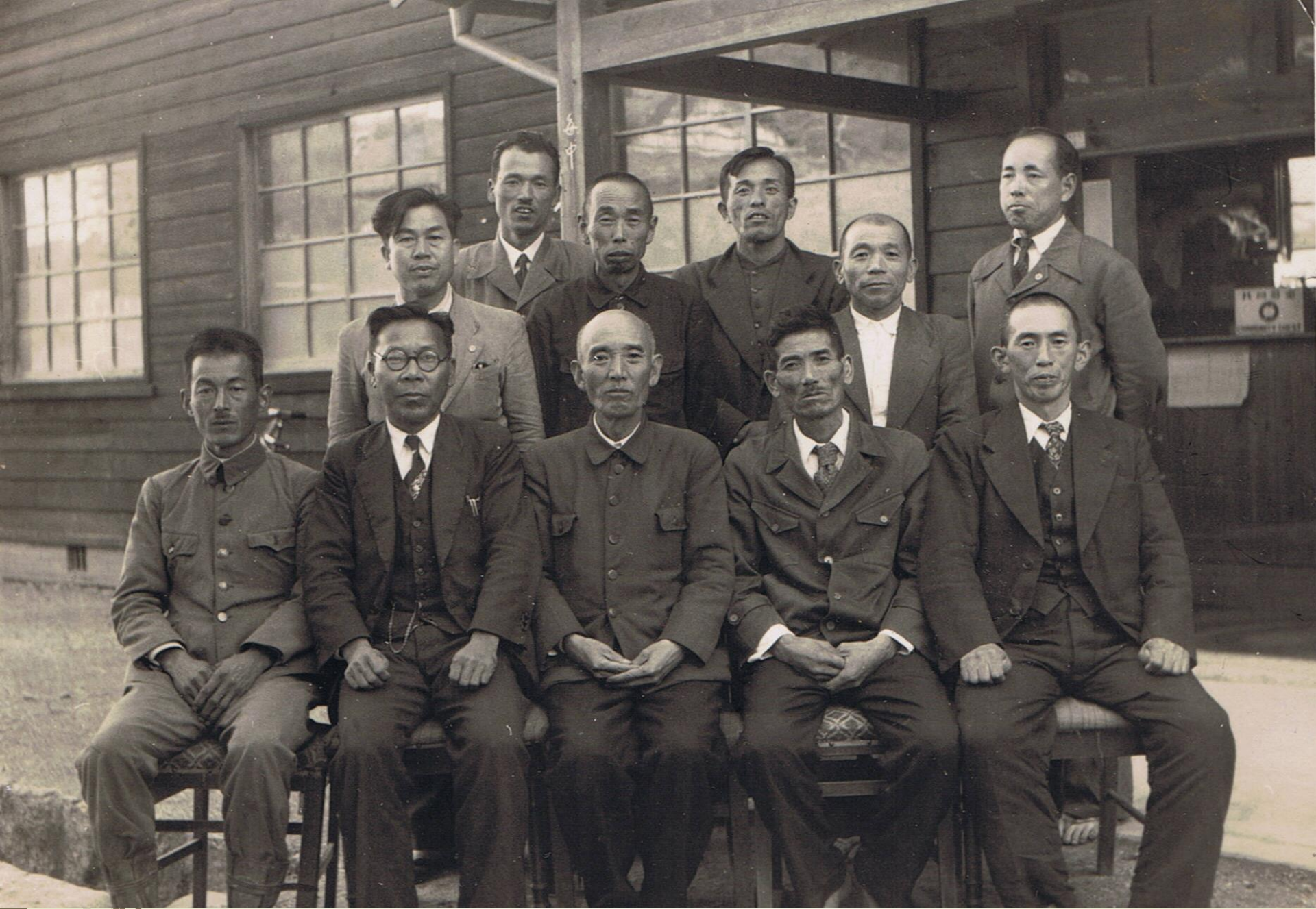
昭和27年 白川教育委員会メンバー6名と村長他