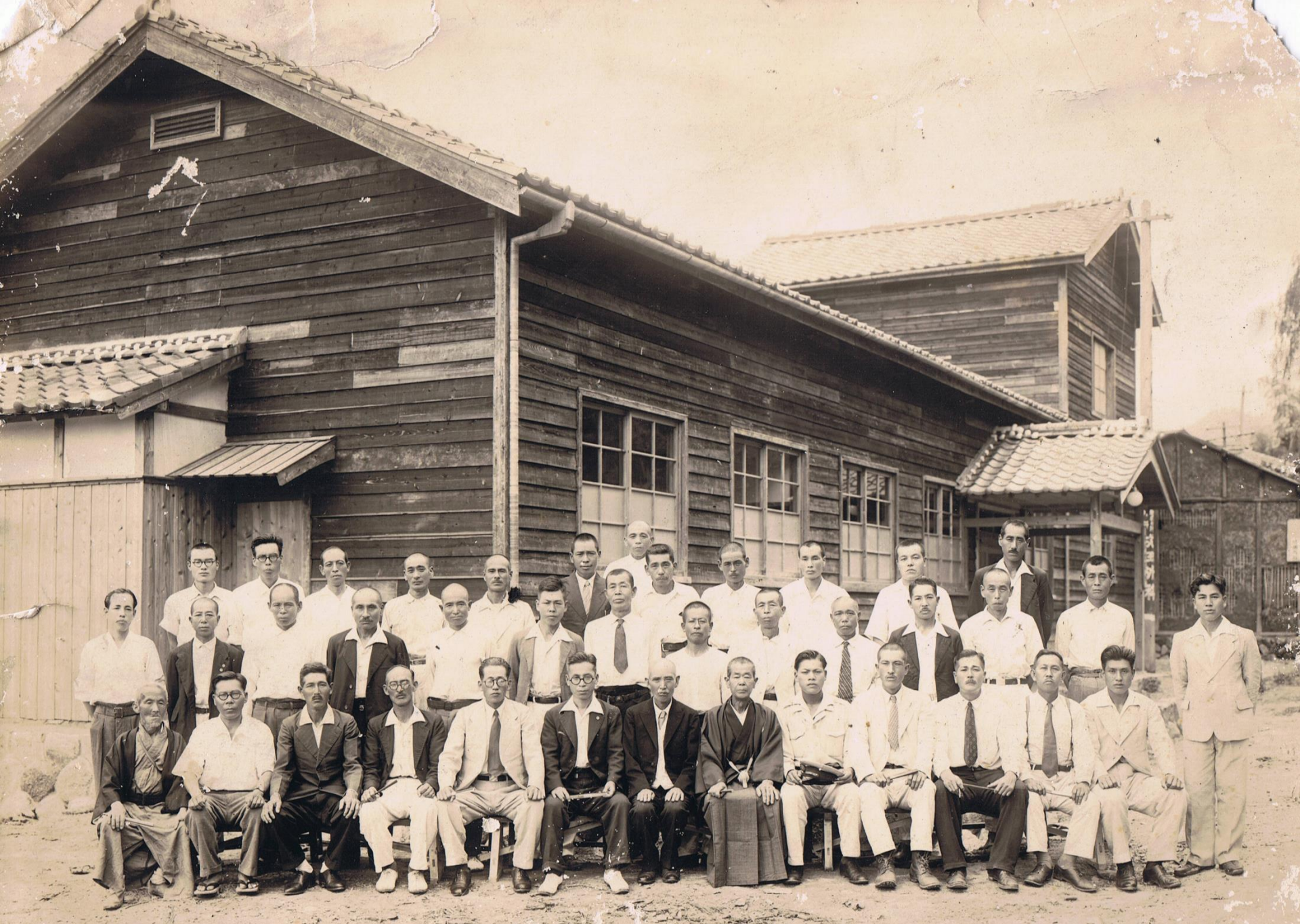
大正7年白川村役場竣工