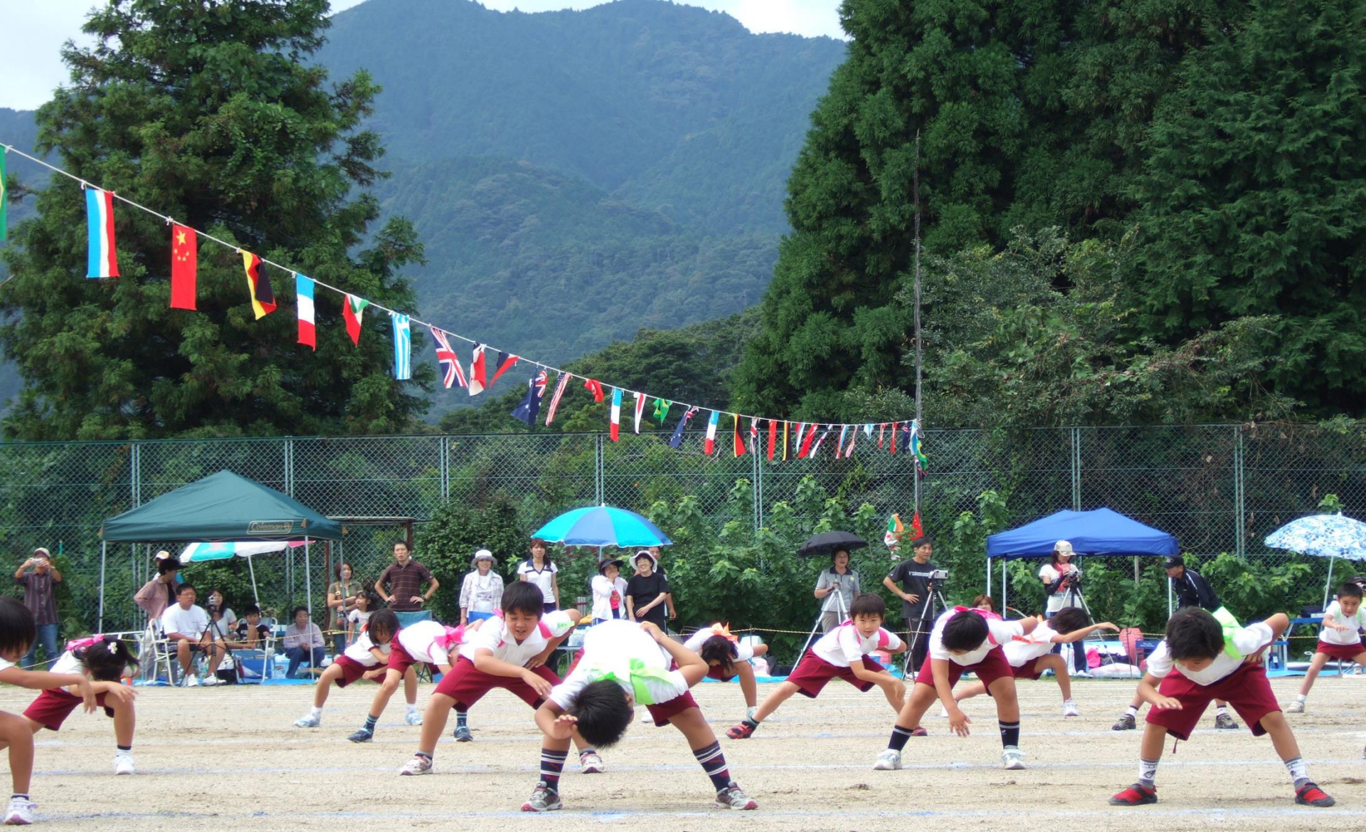
平成20年 運動会よさこい踊り