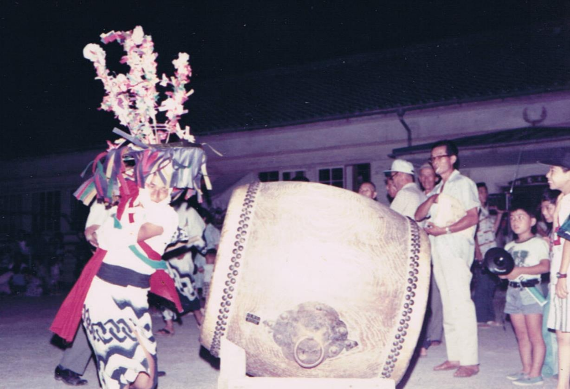
平成2年頃かんこ踊り（小学校）