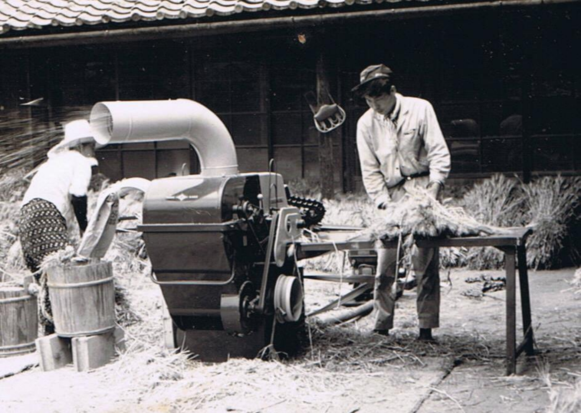
昭和40年頃か 小麦の動力脱穀機作業。