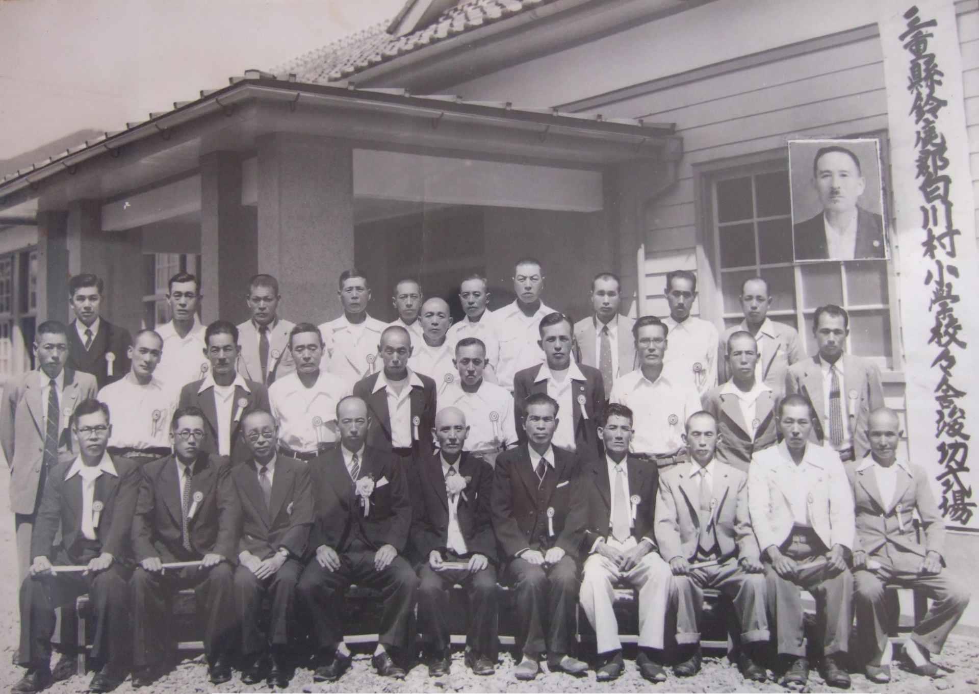
昭和29年白川小学校竣工式。