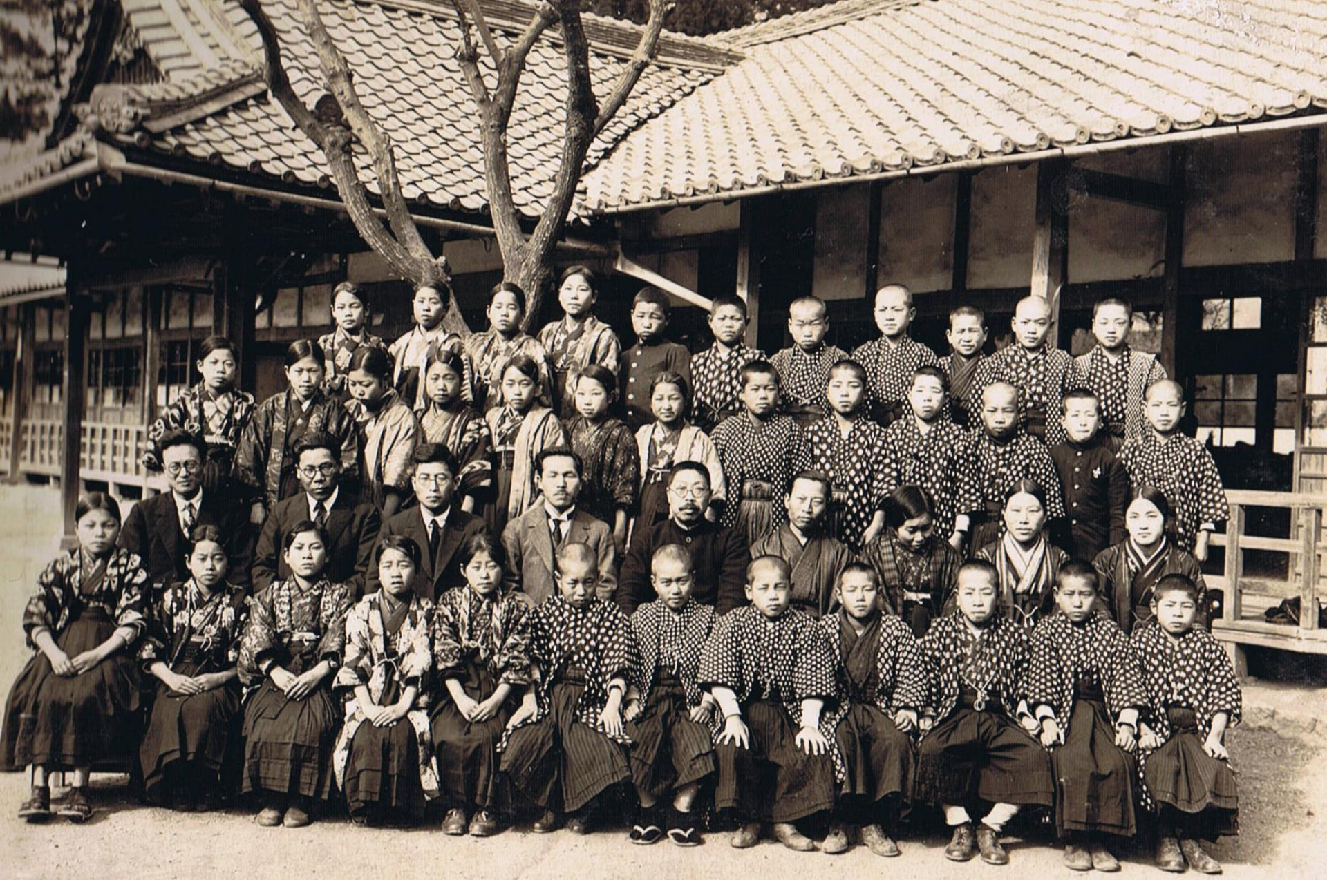
昭和6年尋常科卒業式 玄関右のセンダンの木はこの頃まだ細い。