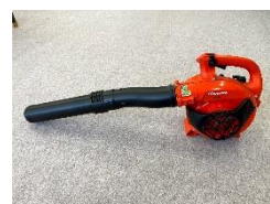
②エンジンブローア