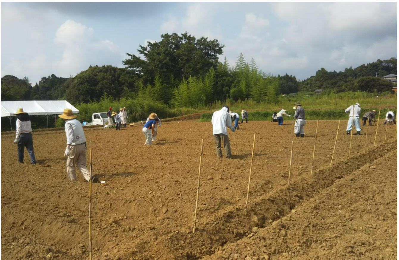
<小川 松山地区のそば畑にて>